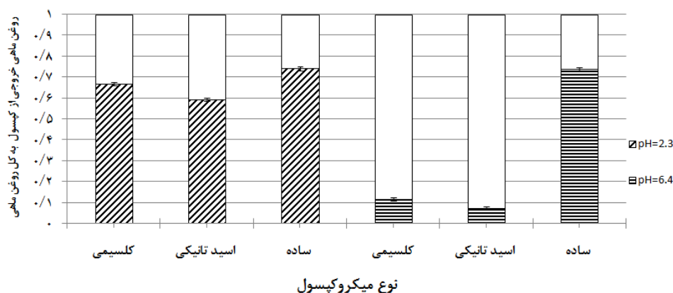
نمودار ۱- تأثیر pH شکمبه (pH=۶/۴) و شیردان (pH=۲/۳) بر آزاد سازی روغن ماهی از ریزکپسول‌های مختلف روغن ماهی در مدت زمان ۲۴ ساعت انکوباسیون آزمایشگاهی در محیط آبی (نسبت روغن ماهی خروجی از کپسول به کل روغن ماهی کپسوله شده)