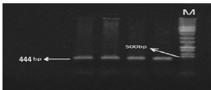
شکل 1- الکتروفورز محصولات PCR بر روی ژل آگارز 1 درصد

دمای 72 درجه سانتی گراد به مدت یک دقیقه انجام گرفت و در پایان یک مرحله گسترش نهایی در دمای 72 درجه سانتی گراد به مدت 10 دقیقه استفاده شد. محصولات PCR روی ژل آگارز 1 درصد