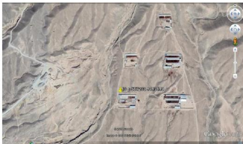
شیروان منطقه ۱ تیمار شاهد بدون مجاورت با کارخانجات