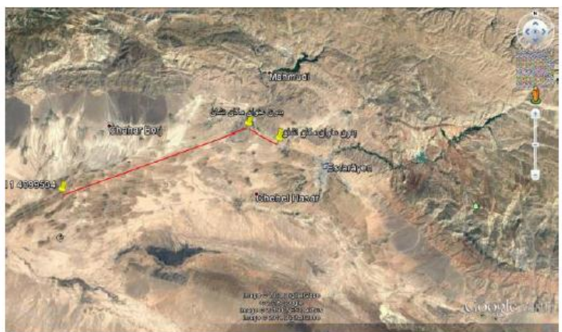
اسفراین منطقه ۲ در مجاورت کارخانه فولاد و لوله گستر